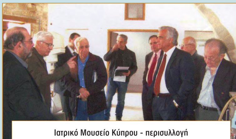
Ιατρικό Μουσείο Κύπρου - περιουλλον

Το οικονομικό κόστος της πρώτης φάσης περιλαμβανομένου και του τεχνικού εξοπλισμού, ανέρχεται στις 82 χιλιάδες περίπου.