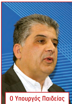
Ο Υπουργός Παιδείας και Πολιτισμού κ. Γιώργος Δημοσθένους

προγράμματος, το οποίο θα αποτελέσει σημαντική