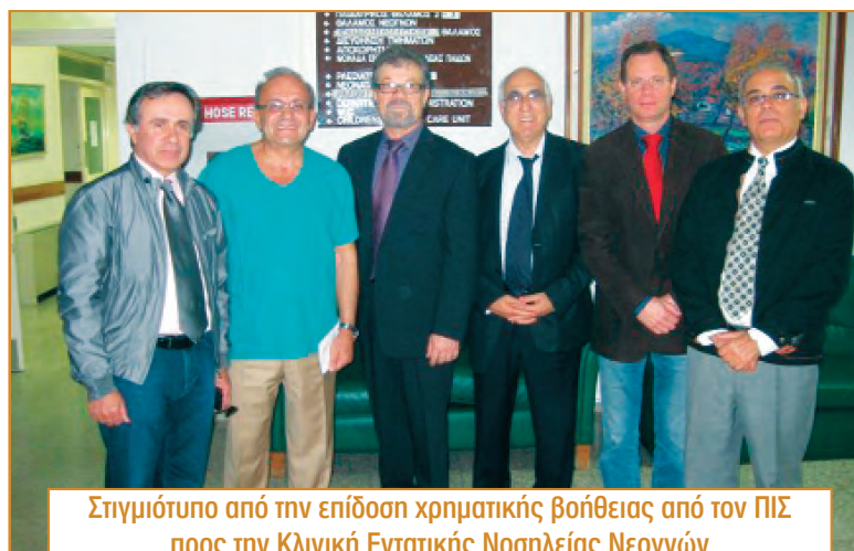
Στιγμιότυπο από την επίδοση χρηματικής βοήθειας από τον ΠΙΣ προς την Κλινική Εντατικής Νοσηλείας Νεογνών του Μακάριου Νοσοκομείου για αγορά εξοπλισμού.

Εκπρόσωποι του Π.Ι.Σ. ήταν παρόντες κάθε Πέμπτη στην Επι-