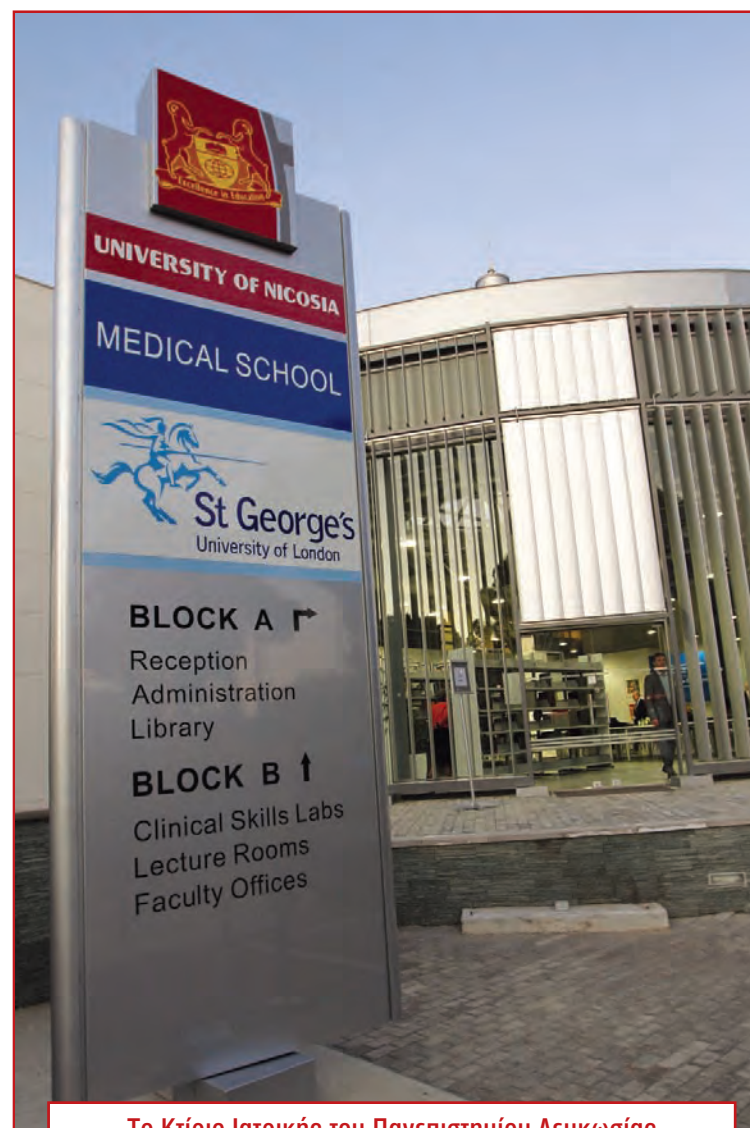
Το Κτίριο Ιατρικής του Πανεπιστημίου Λευκωσίας

Στην εναρκτήρια τελετή στις εγκαταστάσεις της Ιατρικής Σχολής του Πανεπιστημίου Λευκωσίας, ο Διευθυντής του St. George's, καθηγητής Peter Korelman, χαρακτήρισε το πρόγραμμα πρωτοποριακό και καινο-