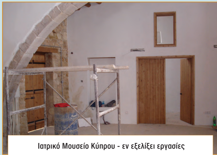
Ιατρικό Μουσείο Κύπρου - εν εξελίξει εργασίες

Σε όλα τα εκθέματα περιγράφεται η χρήση τους, η περίο-