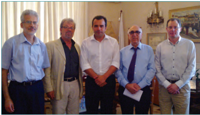
Στη διάρκεια του συνεδρίου της UEMS (European Union of Medical Specialist), που θα πραγματοποιηθεί στην Κύπρο

Στη συνάντηση με τον Δήμαρχο Λευκωσίας συζητήθηκαν θέματα που αφορούν τη φιλοξενία των Ευρωπαίων γιατρών στην Κύπρο καθώς και τρόποι προβολής της ιστορίας της Κύπρου αλλά και το πολιτικό πρόβλημα και οι επιπτώσεις της διχοτόμησης της χώρας